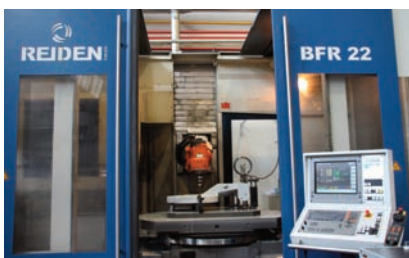
Gussteile messen auf einer REIDEN BFR 22 5-Achs-Maschine.

Bereits 1844 gegründet ist KASTO heute einer der führenden Hersteller von Sägen und Lagern für Metall. Mit etwa 580 Mitarbeitern lag der Umsatz im vergangenen Jahr bei ca. 130 Mio Euro. In der spannenden Fertigung von KASTO folgte man der Empfehlung des Maschinenlieferanten und hat die Maschine mit dem m&h - Messtaster mit Funkübertragung der Signale bestellt. Schnell zeigten