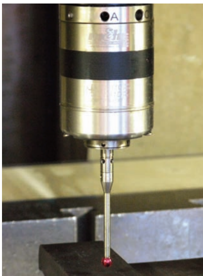
Lagebestimmung am Schweißteil verhindert Ausschuss.

Demgemäss beantwortet Frank Spengler unsere Frage nach einer